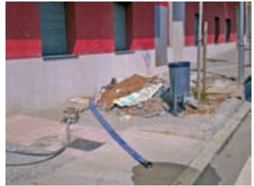
La vorera, per al vianant